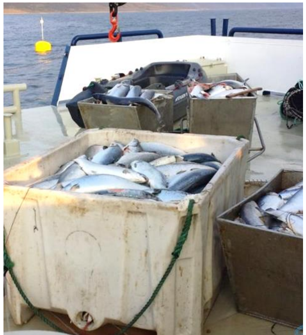
CMS kan gi betydelig dødelighet, enten over tid eller som her i episoder med akutt dødelighet.

CMS er en smittsom sykdom og forebygges primært ved å blokkere virusets smitteveier. Horisontal smitteoverføring med fisk og gjennom vann er de kvantitativt viktigste smitteveiene. Tidlig utslakting reduserer smittepresset lokalt. Viruset er nakent og trolig relativt stabilt i miljø slik at det også kan overføres med utstyr, personell og skadedyr. Viktige tiltak er dermed å bryte smitteveier i tid og rom mellom generasjoner og fiskegrupper. PMCV-screening benyttes for å få kjennskap til smittestatus i fiskegrupper. QTL-selektert rogn med økt motstandskraft mot CMS er på markedet og det arbeides med å få på plass en vaksine. I tillegg er det utviklet funksjonelle fôr som skal sikre næringsopptak og redusere skadeomfanget av sykdommen. CMS syk laks bør ikke utsettes for stressende påkjenninger.