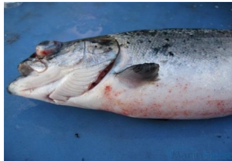
Laks med CMS og sirkulasjonsforstyrrelser; utstående øyne, blødninger i hud og ødem i skjellomme.

Laks i oppdrett er det viktigste kjente reservoaret for PMCV. I tillegg er viruset påvist hos en liten andel villaks og hos vassild. PMCV fra vassild er ulikt virus fra vill og oppdrettet laks (86 % likhet på nukleotide nivå). I 2017 ble det rapportert om funn av PMCV og CMS relatert patologi hos rensefisk i Irland.