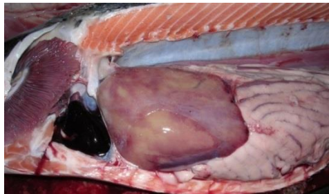
Laks med CMS og sirkulasjonsforstyrrelser; utstående øyne, blødninger i hud og ødem i skjellomme.